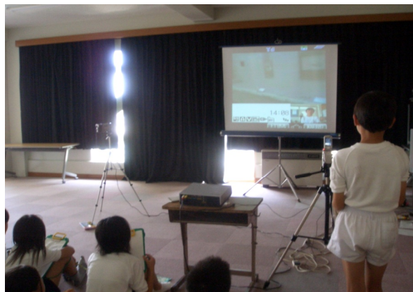
茨城県立近代美術館の学芸員とのTV会議の様子