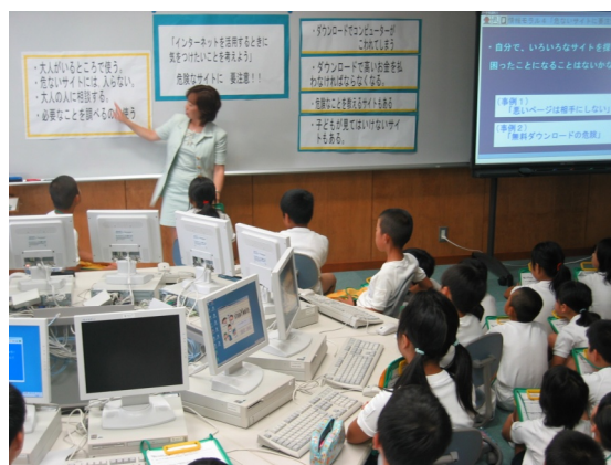
著作権についての授業

図画工作科の導入でインターネットの作品の鑑賞したことや、自分たちの作品の鑑賞の仕方などをふり返り、様々な著作物とどのように関わることで大切にすることができるのかを考えることができた。またワークシートを使って自分が分かったことをまとめたり、家で保護者と著作権について話し合う機会を持つことで、自他の作品を大切にすることや、自分の考えて表すことのよさを感じる事ができた。