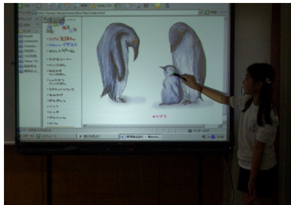
インターネット上の作品を鑑賞し、感想を発表し合う児童達