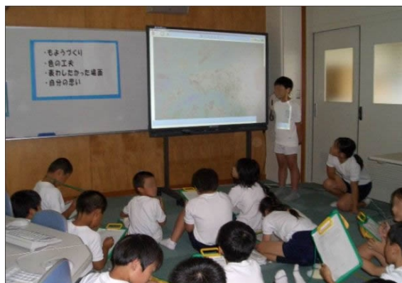
児童同士の作品鑑賞会

その際、作品の工夫点などについてまとめたものも合わせて公開することで、作品をみる人によさや面白さ、作品への思いについても気づいて欲しいと考えた。どの児童も自分の作品や作品についての感想が、インターネット上で様々な人に見られると言うことを理解し、同意した上で作品公開を行うことができた。