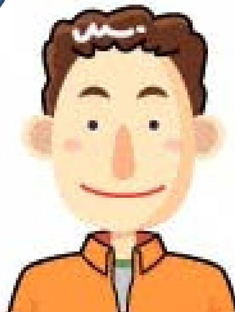
ケイタ君の お父さん