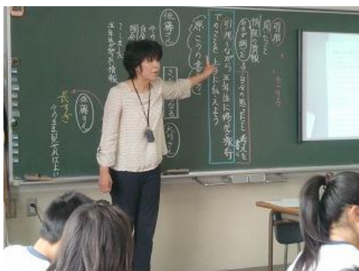
5. 引用のし過ぎについて考えさせる