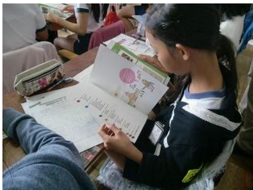
1. 衆議院特別体験プログラムのパンフレットと原稿を比べる