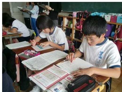
4. 引用している部分に赤線を引く その2