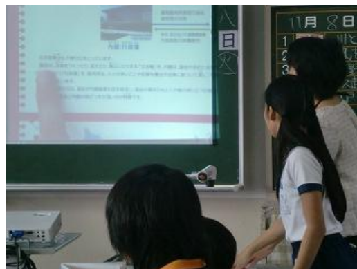
2. 引用部分を指示し、みんなで共有する