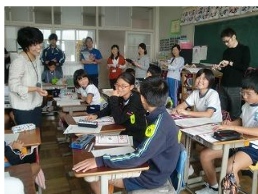
6. 自分の原稿を振り返る