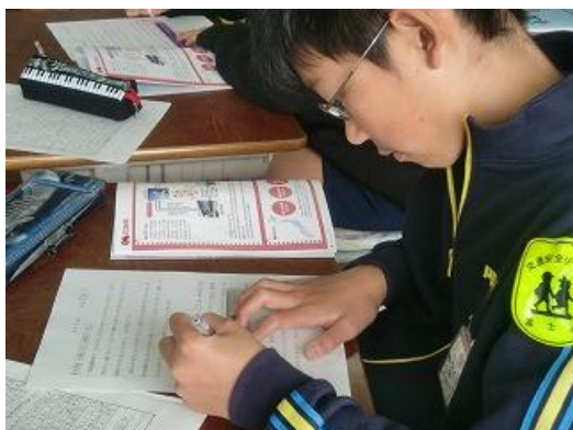
3. 引用している部分に赤線を引く その1